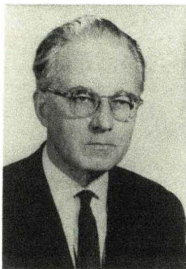
BÓNIS GYÖRGY (1914—1985)

Nemrégiben távozott az élők sorából az a tudós jogtörténész, akinek könyvei, tanulmányai nélkülözhetetlenek a szakembereknek, mindamellet érdekese és izgalmas olvasmányokat jelentenek a múlt történései iránt érdeklődők számára.