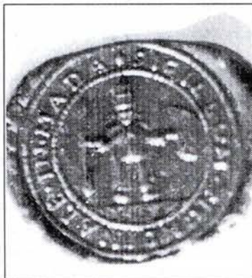
Vásárbírói pecsétnyomó (Nyírmada, 1746 körül)