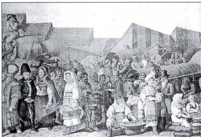
Vásár Erdélyben (Neuhausser-Lanzedelli litográfiája, 1819)

A tordai fazekas céh kezdeményezésére hozták azt a szabályt, hogy az évi egy országos vásárt leszámítva idegen edényeket nem volt szabad behozni a városba eladási céllal, valamint a város szabályozta az edények eladási árát. 6